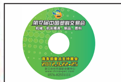
电子会刊外套封底的1/2版面 价格: 10000元/张