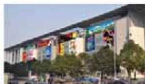
展馆墙体广告 价格: 150元/m 2