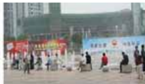
中心广场广告架 (20mX4m) 价格: 12000元