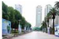
广场广告 (4.4mX3m) 价格: 4000元/个