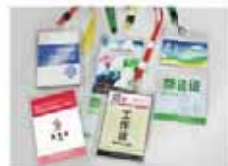
展会证件广告牌 价格: 10000元/万张