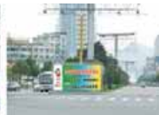
城区临时广告牌 (10个起租) 价格: 8000元/月