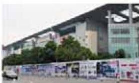
展馆入口广告架 (5mX3m) 价格: 3000元