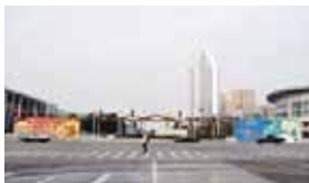
广场南入口广告架 (20.25mX4.3m) 价格: 15000元